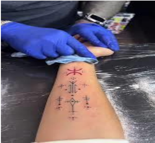
Tatouage féminin amazigh ornemental des mains en Kabylie.

https://www.tiktok.com/discover/tatouage-kabyle-femme